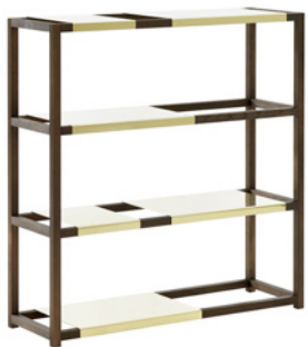
110 x 35 x 114,5 cm 4 isoa ja 2 pientä hyllyä