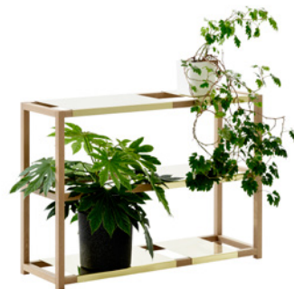
110 x 35 x 78 cm 3 isoa ja 2 pientä hyllyä