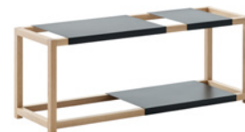
110 x 35 x 41,5 cm 2 isoa ja 1 pieni hylly