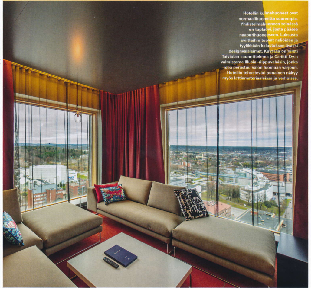
Hotellin kulmahuoneet ovat normaalihuoneita suurempia. Yhdistelmähuoneen seinässä on tuplaovi, josta pääsee naapurihuoneeseen. Luksusta sviitteihin tuovat neljoiden ja tyylikkään kalustuksen lisäksi designvalaisimet. Kuvassa on Kirsti Taivolan suunnittelema ja Cariitti Oy:n valmistama Illusia -riippuvalaisin, jonka idea perustuu valon luomaan varjoon. Hotellin tehosteväri punainen näkyy myös lattiamateriaaleissa ja verhoissa.

Hotellin tulee tarjota elämyksiä. Sviittien ohessa olevista kylpyhuoneista ja saunoista tehtiin mustat. Saunojen puutyöt on tehnyt Saunapojat Oy. Lauteissa on kevyt alumiinirunkoinen kippimekanismi.