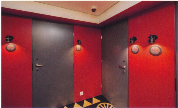
Käytävillä on epäsuora yleisvalo, jonka lisäksi tilaan tuovat valoa numerovalot. Kuva on 22. kerroksesta. Asennukset on toteutettu ilman listoja.